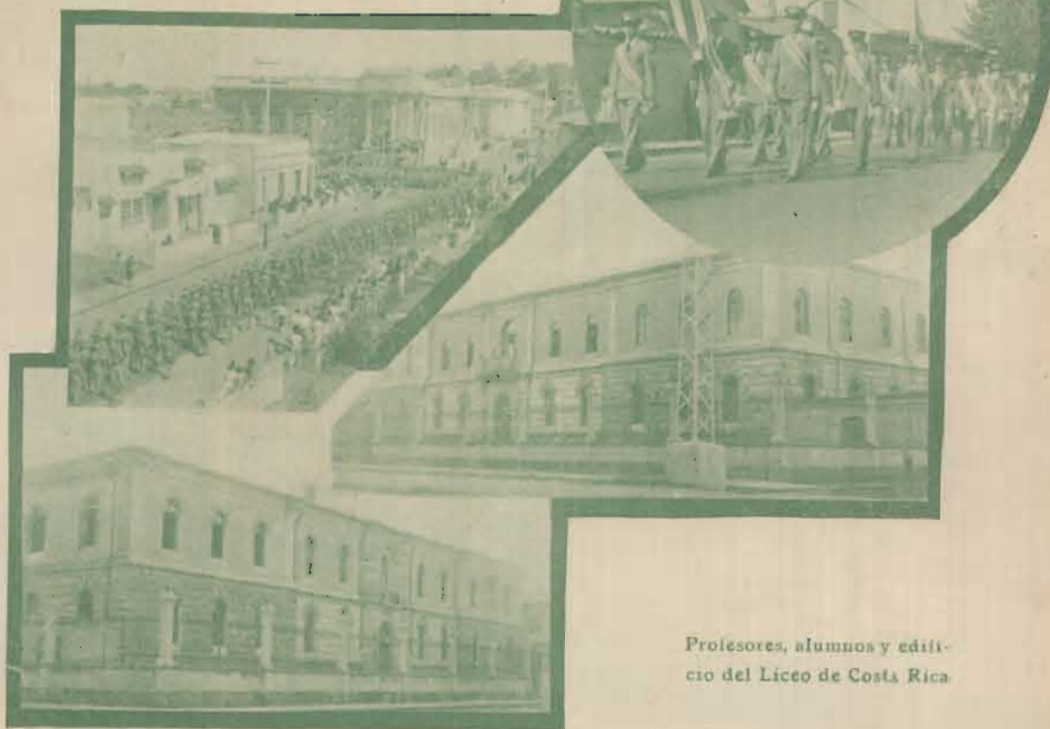
Profesores, alumnos y edificio del Liceo de Costa Rica